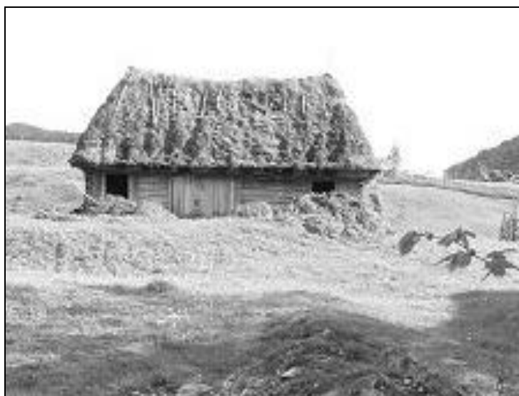
Adăpost pentru animale pe Valea Gugii

cu însemnarea trunchiurilor, urmată de doborâtul și curățatul lor; buștenii se ciopleau cu barda după o linie fixată cu șparga (sfoară de cânepă); corhănitul (buitul) buștenilor sau meterilor (bușteni la dimensiunea de 1 m) se făcea cu țapina și transportul primar se realiza pe jilipuri și valauă (jgheaburi semitronconice); uneltele folosite erau firezul, toporul (săcurea), barda (plancacea), țapina, icul de fier; transportul materialului lemnos se făcea cu boii sau caii (cu lanțul de la tânjală și căruțele). Lemnul nu era folosit până la uscarea completă.