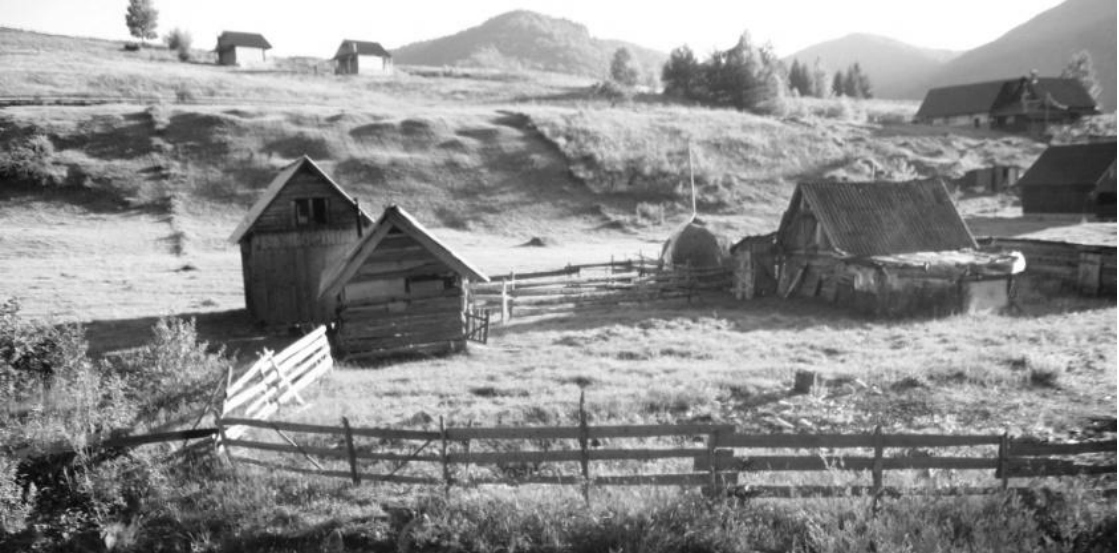
Gospodăria temporare și grajduri pe Valea Gugii